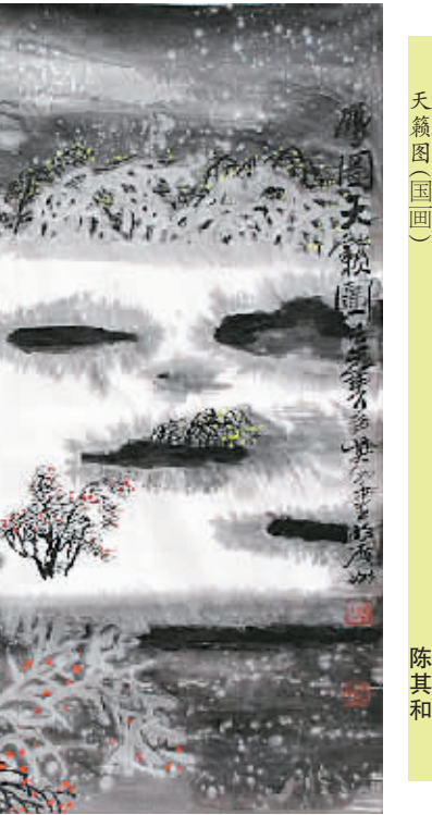
天籟图(国画) 陈其和

公元6世纪初,后魏孝文帝兴造的永宁寺有九层宝塔,塔高九十丈,宝塔的每一层屋檐下的四角各垂有金铎(一种大铃)一口,上下九层,共装有一百二十口,《洛阳伽蓝记》载:“高风水夜,宝铎和鸣,铿铎之声,闻及十余里。”