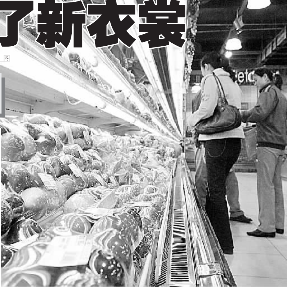
■本报记者 刘招文 李焱 图

本报讯(记者 张丽霞)由郑州燃气公司与本报联合开展的“发扬长征精神,构建和谐社区——郑燃牛师傅杯征文大赛”活动圆满结束,最终有7篇作品脱颖而出,分别获得一、二、三等奖。郑燃“牛师傅杯”征文大赛从2006年11月1日启动,截至2007年2月结束,为期三个月。期间共收到来自社会各界的征文作品40余篇。经评委认真评