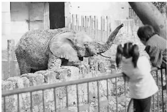
2月25日,武汉动物园一头名叫“阿海”的大象因不堪游客频繁“袭击”,用鼻子卷起石块还击,将一名小女孩头部砸伤。工作人员随即赶到,将女童送往医院。经检查,女童眉骨受伤,是否伤及眼睛仍待观察。

日在北京签署了中、越、老三国国界交界点的条约。 条约规定:“缔约三方共同在三国国界交界点上竖立一棵花岗岩界碑。任何一方不得单方面改变界碑的位置、式样和规格及竖立其他任何界碑。”