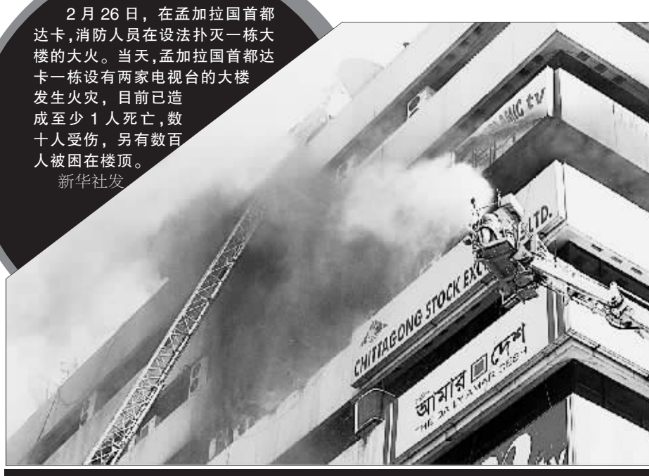
2月26日,在孟加拉国首都达卡,消防人员在设法扑灭一栋大楼的大火。当天,孟加拉国首都达卡一栋设有两家电视台的大楼发生火灾,目前已造成至少1人死亡,数十人受伤,另有数百人被困在楼内。

在最初报道中,有人说阿卜杜勒·迈赫迪没有受伤。但一名来自什叶派阿拉伯政党联盟的高级政治人士告诉路透社记者,阿卜杜勒·迈赫迪受到轻伤。 伊拉克市政和公共工程部位于巴格达曼苏尔地区,该地区有很多使馆建筑。目前,警方尚不知道这起爆炸是否属于针对阿卜杜勒·迈赫迪的暗杀阴谋。 警方说,尚不清楚此次爆炸由什么引起。由于近期针对汽车炸弹的检查更为严格,许多非法武装人员选择自杀式炸弹背心实施爆炸袭击。