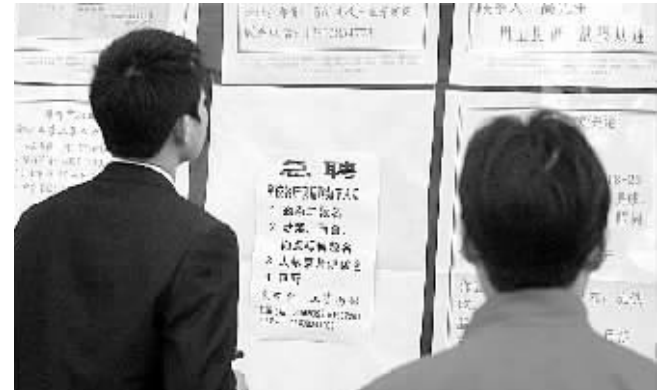
昨日,郑州市劳动就业服务管理中心刚刚开门上班,就有众多外来求职人员来到,窗口查看求职信息,期望新年能找到合适的工作岗位。