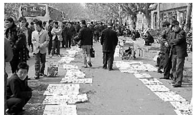
昨日,一马路上站满了返城找工作的农民工,且大多数是只会厨师手艺。因为求职者少,现场显得冷冷清清。记者提醒农民工朋友,要及时了解招工信息,减少外出务工的盲目性,加强技能培训,拓宽就业渠道。

本报讯(记者 王红 新刚)见习记者 秦华)新年伊始,求职迎来好机会。昨日,记者从市人才交流中心获悉,3月10日~11日,市人事部门将在郑州人才大厦(陇海西路与伏牛路交叉口西200米)举办2007年首次大型人才交流会,1.2万个就业岗位虚位以待。据统计,本次参会单位中知名企业较多,涉及教育、餐饮、房地产、机械、电子、化工等二十多种行业400多家用人单位,共提供职位1.2万个。和往年相比,高中低层营销人员仍是招聘热点,此外技工类人员、售后服务人员、中层管理人员需求量较大。此外,网上人才招聘会也将同期举行,大会的所有招聘信息都将通过天生我才网、郑州人才网公开发布。大会还在现场设立咨询台和现场办公处,进行人事、人才交流政策咨询,并为用人单位和各类人才现场办理有关手续。