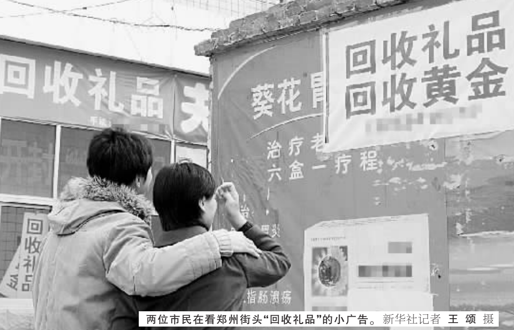
两位市民在看郑州街头“回收礼品”的小广告。

春节刚刚收起脚步, 街上名烟酒店“礼品回收”又开始热闹起来, 甚至在春节礼品回收的生意也做得沸沸扬扬。不少市民把家中消费不了的烟酒、保健品赠品等送到这些礼品回收处换成现金, 而这些店铺的老板也称开办这样的项目是解了市民的“燃眉之急”。但是, 昨日记者从工商部门获知: “回收烟酒等礼品, 毫无疑问是违法经营行为。”