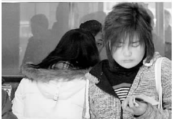
为迎“三八国际妇女节”,郑州长途汽车中心站开设了女性购票窗口,方便妇女们购票。

记者调查显示,相当数量的大学生存压岁钱等着开学后娱乐享受,也有大学生准备将压岁钱投资学习,巨大的反差让人疑惑——