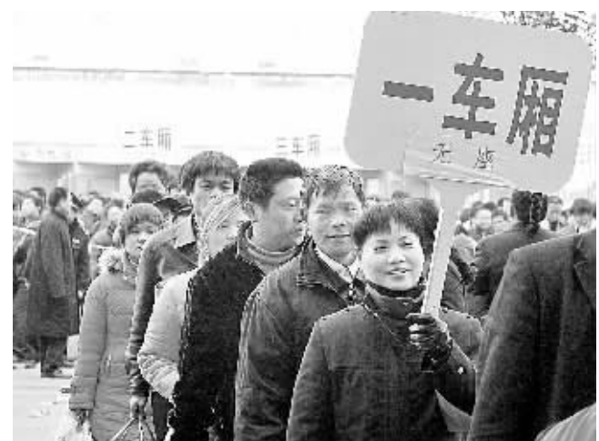
这几天是外出务工人员出发的高峰期,为缓冲客流对郑州火车站站内的压力,旅客在广场上按车厢排好队伍,准备进站。

处理事故的任警官说,交警部门将聘请有关专家对该车进行技术分析和检验鉴定,确认刹车突然失灵的原因。