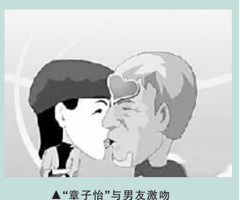
▲“章子怡”与男友激吻 ▼“章子怡”猛闯红灯会情郎

从前总是被捧得高高在上、遥不可及的明星们，近来频频遭遇网络恶搞攻击。最近，在某网站时兴一种FLASH游戏，其“中心思想”就是拿明星“开涮”——以最火的明星作为主角，最热的新闻事件做背景，任明星在玩家操纵中腾挪跌宕。而记者了解到，因为游戏制作方用已公开的新闻事件做背景，又用漫画形式来绘制人物，所以明星即便被“整”，也只能忍气吞声，难以维权。