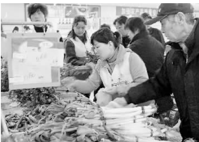
金海农贸市场从大学路搬迁到长江路后,方便了新城区附近居民生活。

同期,新增基金开户数为105万户,新发行的基金被踊跃认购一空,仅上两周新成立的基金就有700多亿元的待建仓资金,令股市下调空间有限。 不过,此间有不少证券分析师对后市发展持审慎态度。招商证券研发中心研究员景志钟表示,19日反弹走势能否持续,还有待观察。他认为,内地股市的估值水平目前仍远高于国际水平,使得股市短期向上突破会遇到很大的阻力。有的分析员也指出,近期快速拉升之后,一些劣质品种的股价已显著高估,非蓝筹股的整体市盈率近期提升很快,许多个股市盈率已高达60倍以上,将踏上价值回归之路。 还有分析员指出,股改后许多上市公司里的“小非”股东(指持股比例小于5%的原非流通股)和“大非”股东(指持股比例大于5%但不控股的原非流通股)正取得流通股,大非小非减持近期成风,对股市上行构成了沉重的压力。据估计,今年将有881亿多股来自“小非”和“大非”的限售股进入二级市场流通。所以,他们认为深沪股市短期难改箱形盘整的格局。 新华社深圳3月19日专电