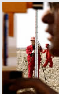
自今年1月10日起,新疆第一测绘院的人员进入艾丁湖,开始重新测量我国内陆最低点。

2005年,民政部设立“中华慈善奖”,定期评比表彰在赈灾、扶贫、助残、救孤、济困、助学、助医以及支持文化艺术、环境保护等公益慈善领域做出突出贡献的个人、机构及项目,这是中国慈善事业最高政府奖项。