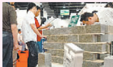
警惕建筑节能走过场