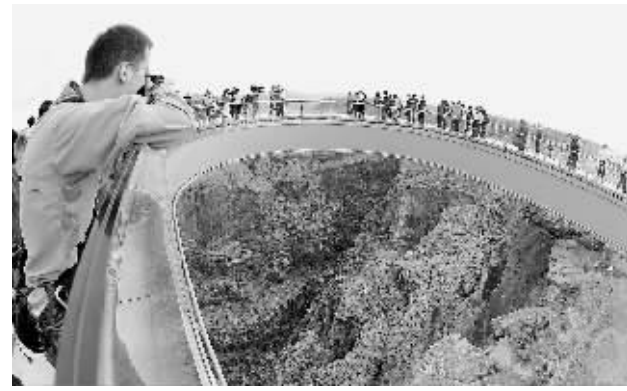
3月20日,在美国亚利桑那州的大峡谷,一名记者在“空中天桥”上拍摄大峡谷美景。当天,这座“空中天桥”正式揭幕。它距离地面1200米,钢结构的马蹄形桥体延伸出崖壁21米,桥面为强化透明玻璃,可同时容纳120名游客。游客走在桥上似“云中漫步”,并可以通过脚下透明的玻璃清楚地看到1200米下的大峡谷美景。

据新华社日内瓦3月20日电(记者 刘国远)中国常驻世界贸易组织代表团20日发表声明说,中国与墨西哥和墨西哥20日就所谓“中国贸易补贴问题”举行了联合磋商。声明表示,起诉方对于中国的外商投资制度以及税收法律制度存在误解。实际上,起诉方提出的一些所谓的“补贴”项目在中国实践中早已不存在。还有一些“补贴”项目早就在中国企业所得税制改革的日程上。在磋商中,中方向对方认真介绍和澄清了涉及的有关税收政策,一定程度上澄清了误解。今年2月初,美国政府正式就所谓“中国贸易补贴问题”向世贸组织提出诉讼,要求与中国在世贸组织争端解决机制下展开磋商,墨西哥后来提出加入美国对中国的诉讼。