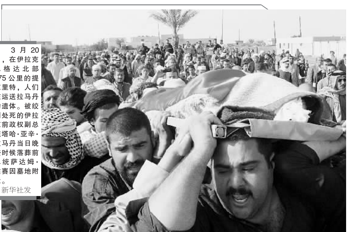
3月20日,在伊拉克巴格达北部175公里的提克里特,人们在运送拉马丹的遗体。被绞刑处死的伊拉克前政副总统塔哈·亚辛·拉马丹当日晚些时候落葬前总统萨达姆·侯赛因墓地附近。

根据各方达成的共识,本轮六方会谈将重点进行三个议程:一是听取各工作组报告工作进展情况,二是讨论落实起步行动的具