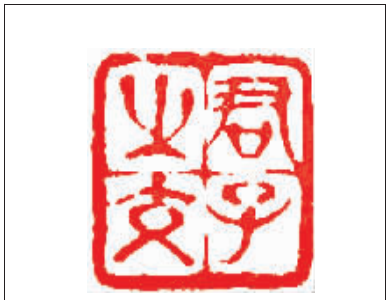
君子之交(篆刻) 益刃

2007年3月9日(农历丁亥年正月二十),诸文友聚集西峡,研讨乔典运的创作思想及小说艺术,纪念他辞世10周年。七嘴八舌,你言我语,长篇大论,简短发言,说他的作品,说他的逸事,说他