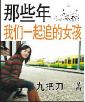
那些年 我们一起追过的女孩 九把刀 著