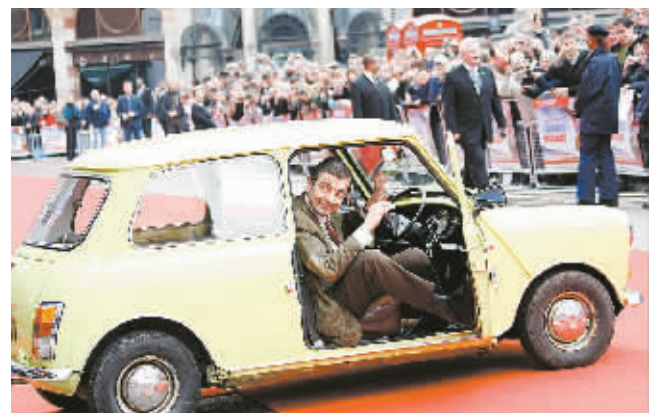
3月25日,《憨豆先生的假期》主演罗恩·阿特金森在英国伦敦参加该片首映式。《憨豆先生的假期》是“憨豆先生”系列的第二部电影。

据了解,作为纪念杜甫诞辰1300周年大型活动发行的《杜甫》系列丛书之一,新编的《杜甫年谱》填补了我国关于详细介绍杜甫生平资料的一项空白。该书开篇恢弘,内容翔实,结构严谨,涵盖了杜甫的谱系、家世、正史、交游、诗证、人名解、地名解和杜甫编年等八个方面的内容,对杜甫生平进行了完整、系统、翔实的阐述。