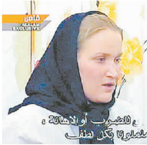
特尼说,他们很好,我们没有受到伤害。

为促使伊朗方面释放被扣押的15名英军士兵,英国政府已求助于联合国安理会,希望安理会在29日发表声明,“谴责”伊方举动。英国国防部更于28日公布士兵被扣的来龙去脉,称这些士兵当时处于伊拉克水域。英媒体则报道说,他们中了伊朗“伏击”。