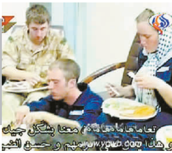
电视画面显示被扣英军就餐情景。