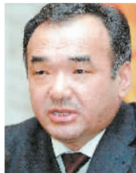
新华社电 吉尔吉斯斯坦政府发言人29日说,总统巴基耶夫已批准总理伊萨别科夫(如图)的辞