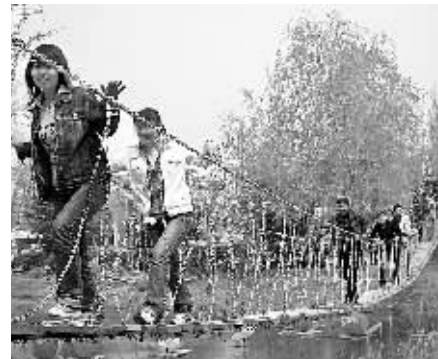
记者昨日从省会多家景区了解到,虽然“五一”黄金周还有一个月时间,但每逢双休日,接待客流已呈“井喷”态势。

与以前相比,期货交易所管理办法修订草案将交易所由原来单纯的会员制,改为会员制与公司制并存的模式。