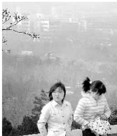
上图:3月31日中午开始,受西北和华北地区沙尘天气的影响,山东省出现大范围浮尘天气。