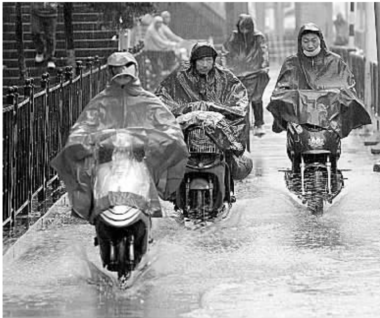
右图:4月1日,受冷空气影响,南京出现大雨,气温大幅度下降。