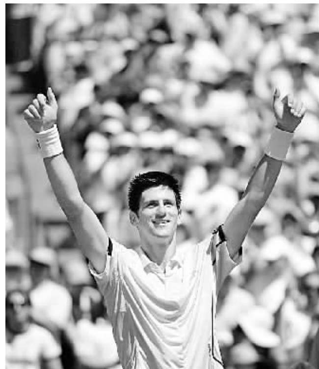
4月1日,塞尔维亚选手焦科维奇在比赛后向观众致意。当日,在美国迈阿密举行的索尼爱立信网球公开赛男单决赛中,19岁的焦科维奇直落三盘,击败阿根廷老将卡纳斯,夺得这项“第五大公开赛”的冠军。

红牌罚下。 五、赛后,在体育场外,河南球迷向回宾馆的山东队大巴车上的国家队队员招手致意时,山东队队员竟然在大巴车上朝河南球迷竖中指,引发河南球迷向大巴车投掷杂物。 针对以上五点情况河南建业足球俱乐部提出如下申诉: 一、山东队6号韩鹏有意推倒河南队队员姚冰,根据《足球竞赛规则》和《2007年中国足协各级比赛统一判罚尺度》的精神,韩鹏的行为属球场暴力行为,应如齐达内头顶马特拉奇之判罚尺度,不应降格处罚,当给予红牌。 二、根据中国足协赛场管理精神,“加强替补席管理”被三令五申,山东队替补席管理混乱,相关人员应得到相应处罚。 三、巴辛“球过人不过”的犯规行为明显破坏了河南队员肖智的得分机会,根据《足球竞赛规则》和《2007年中国足协各级比赛统一判罚尺度》的精神,不应降格处罚,当给予红牌。 四、李微的飞铲带有明显的报复心态,中国足协应对此种行为给予追加处罚。 五、河南队是升班马,抱着学习的态度积极准备比赛,然而山东队在赛中(1张红牌4张黄牌)和赛后(朝河南球迷竖中指)的表现实在令人失望,山东队是2006年的双冠王,着实有失冠军球队的风度和姿态。 河南建业足球俱乐部希望中国足协协会维护公平竞赛的环境,并保护弱势球队队员安全,严格贯彻执行球场判罚尺度,一视同仁,保证联赛公正、顺利进行。