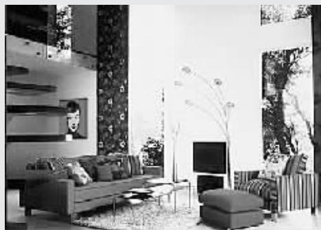
除了香艳还要精致

还有就是装修中要尽量多留白,毕竟生活是一点点地积累的。这些留白可以用来安置记忆的碎片,比如照片、旅行的纪念品、有价值的小礼物等。