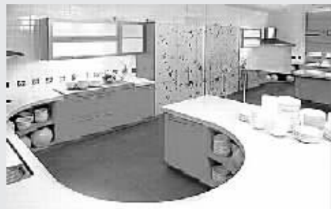
厨房和餐厅美丽与感性做主线