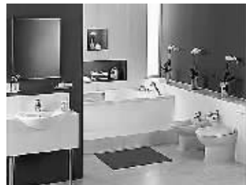
红色总是让人充满热情,同时又给人舒适的感觉

许多人已将室内设计看成是最能展示现代生活环境创造活动的一种方式,并认为它不仅表现了一个处理环境、认识生活的基本修养,而且也对人们的精神生活产生着重要影响。卫浴空间这个特殊的角落更能体现出人们对精神生活的追求。受这种观念支配,不少人在卫浴空间设计上追求一种个性化、舒适化的感觉。