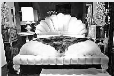
卧室享受舒适的呵护