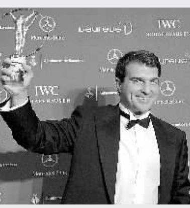
巴塞罗那俱乐部主席拉波尔塔代表俱乐部领取年度最佳体育精神奖。