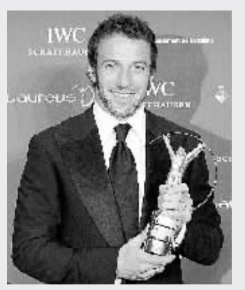
皮耶罗代表意大利男足领取年度最佳团队奖。