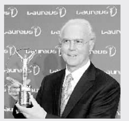
德国足球传奇人物贝肯鲍尔获得劳伦斯终身成就奖。