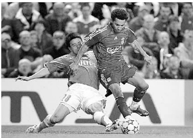
左图：孙祥在比赛中防守。作为第一位出现在欧冠联赛1/4决赛赛场上的中国球员，他的表现中规中矩。