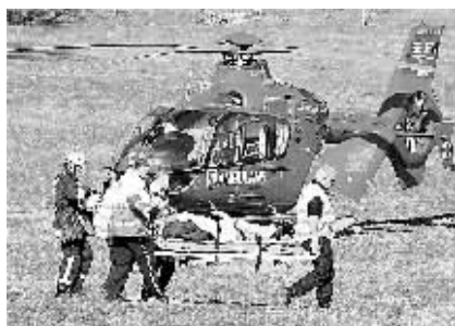
4月12日,一架载有4人的私人飞机因发动机出现故障在紧急降落时撞上斯德哥尔摩一公园内的树木坠毁。伤者目前已经被运离坠机现场。救援人员现场将伤者送上救护直升机。

这名男子名叫克里斯托夫·保罗,现年43岁,家住俄亥俄州哥伦布市。俄亥俄州一个联邦陪审团12日公布的起诉书说,保罗上世纪90年代初期前往巴基斯坦和阿富汗,和当地的“基地”组织成员建立联系。保罗加入了阿富汗境内一个“基地”组织训练营接受训练。由于表现突出,保罗被选中接受“地图辨识、攀登、使用绳索下降、军事历史和爆炸物使用等方面的高级培训”。如果罪名成立,保罗将面临终身监禁。