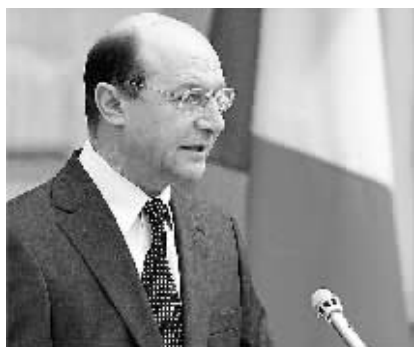
4月12日,罗马尼亚总统伯塞斯库表示,如果议会通过弹劾总统议案,他将立即宣布辞职。这是2007年4月5日拍摄的罗总统伯塞斯库的资料照片。

这家报纸援引马利基的话报道说:“我相信,韩国驻伊部队将从下月开始削减,在不久的将来开始全面撤军。”