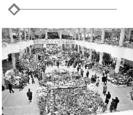
4月13日,人们在朝鲜平壤参观第九届金日成花展。此次花展是为纪念朝鲜已故国家主席金日成诞辰95周年而举行的众多活动之一。新华社发

在12日辩论中,反对党议员同自民党议员发生冲突,一些反对党议员一度冲到议长席抢夺话筒。日本首相安倍晋三将修宪作为其执政目标之一。安倍7日曾表示,希望在5月3日,即日本和平宪法60周年纪念日,在国会通过有关全民投票的法案,为修改和平宪法铺平道路。