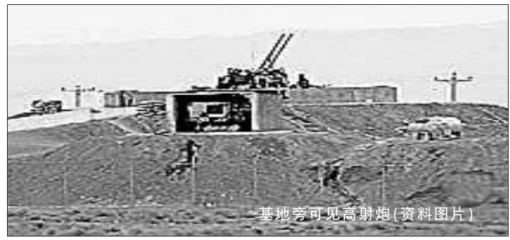
基地旁可见高射炮(资料图片)