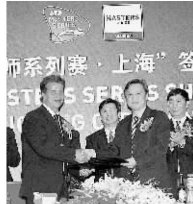
4月16日,ATP国际区总裁布莱德·德拉维特(左一)和上海市体育局局长于晨共同签署“ATP大师系列赛·上海”协议。根据协议,上海从2009年开始将永久拥有ATP大师系列赛的举办权。上海也成为了亚洲第一个拥有ATP大师系列赛的城市。