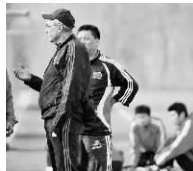
4月16日,中国国奥队主教练、国家技术顾问杜伊科维奇(左)在场边和国家队教练组交流。当日,应中国足球队邀请,杜伊率国奥队教练组一起观看国家队在济南鲁能泰山基地的集训。

切尔西老板阿布亲临现场观战,并在球队进球时鼓掌微笑。最近一直有传言称,由于阿同穆里尼奥不合,后者有可能在本赛季后卷铺盖走人。