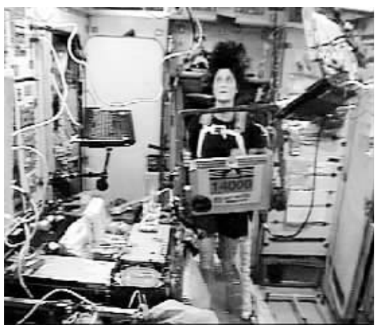
正在进行比赛的威廉斯。

体能锻炼其本身就是宇航员训练的一项重要内容,因为长期的太空失重状态对宇航员的身体健康是个巨大的考验,如骨密度、肌肉等都会受到影响。因此,驻站宇航员在空间站上都必须在跑步机及耐力训练机上定期锻炼。