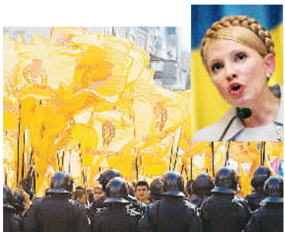
4月18日,在乌克兰首都基辅,议会反对派的支持者举行集会,防暴警察维持现场秩序。乌克兰议会主要反对派政党季莫申科当天说,她领导的议会党团内全部议员声明放弃议员资格,以迫使议会停止运作。

驻伊美军发言人18日对记者说:“我们发现的大量证据表明,我们仍然面对巨大挑战。”