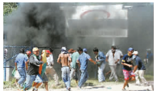
4月18日,在玻利维亚的亚奎瓦市发生骚乱,上千名示威群众闯入冲击一家英国与荷兰合资的天然气加工厂,关闭了连接阿根廷的输气管道阀门。他们希望此举能迫使当地政府尽快解决玛格丽塔油气田的归属问题。