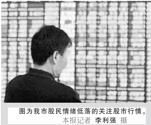
图为我市股民情绪低落的关注股市行情。

新华社北京4月19日电(记者江国成潘清)承接周三的下调,沪深股市大盘19日低开出现近一个月来少见的大规模深幅下跌:上证综指和深证成指分别下跌163点和544点,收报于3449.02点和9857.23点,跌幅为4.52%、5.23%。