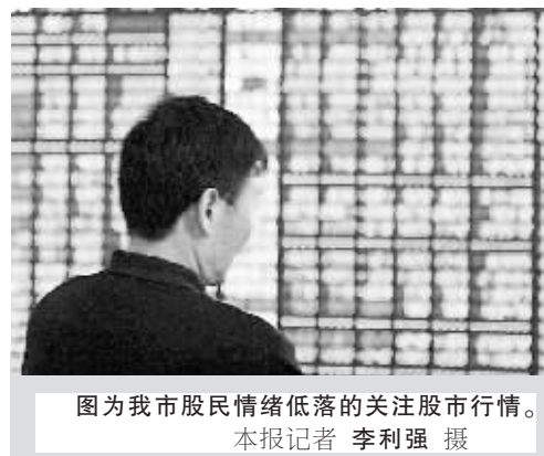
图为我市股民情绪低落的关注股市行情。

新华社北京4月19日电(记者 江国成 潘清) 承接周三的下调,沪深股市大盘19日低开出现近一个月来少见的大规模深幅下跌:上证综指和深证成指分别下跌163点和544点,收报于3449.02点和9857.23点,跌幅为4.52%、5.23%。