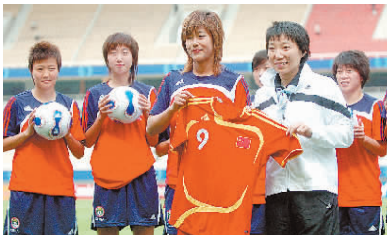
4月20日,前中国女足队长孙雯(右二)和现役女足队员韩端(左三)等与女足新球衣合影。当日,中国国家女子足球队与世界明星联队在武汉积极训练,备战将于21日进行的热身赛。届时,中国女足队员将身穿新球衣出战。

4月20日,前中国女足队长孙雯(右二)和现役女足队员韩端(左三)等与女足新球衣合影。当日,中国国家女子足球队与世界明星联队在武汉积极训练,备战将于21日进行的热身赛。届时,中国女足队员将身穿新球衣出战。