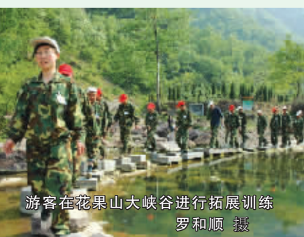
游客在花果山峡谷进行拓展训练