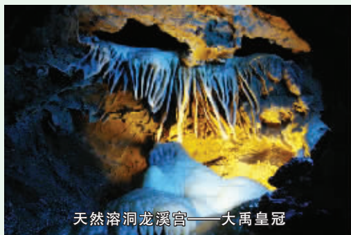
天然溶洞龙溪宫——大禹皇冠

剔透、形色各异,长达5米的龙形化石,演绎着大自然的奥妙和神奇,堪为中原一绝;十里杏花沟,春则杏花烂漫,夏则硕果累累;漫步景区,但见古树参天,奇石林立,野玫瑰和野牡丹争红斗妍,红腿螃蟹环抱着五彩奇石;雌雄同株、树根与树干等高的千年槐树左绿右红,独自演奏生命的欢歌;形如伞盖,大似庭院的万年古檀树峥嵘挺拔;有“天然氧吧”之称的万亩橡子林清爽宜人;精美的千年石花,如一首千年歌谣,悠长而醇厚。景区人文景观丰富多样,远古人物传说众多,历史上有许多帝王和文人来此游历。被奉为“先蚕”、“蚕神”的黄帝元妃——螺祖相传就出生在这里,并在这里养蚕织衣,成为我国丝绸的先祖。乾隆湖、卧龙岗、三寿石等古迹,记录和见证着帝王们的足迹。景区内保护完好的明清古城堡既有垛口、女墙等八达岭长城的风格,又有三座威严的城门楼,呈现出古城寨的雄伟风姿;九九香港回归钟(警世钟)系当年董建华先生所赠,为我国仅有的两大警世钟之一。具有较高观赏价值和历史文化价值的环翠峪风景名胜区已成为郑州市民的“山水后花园”。