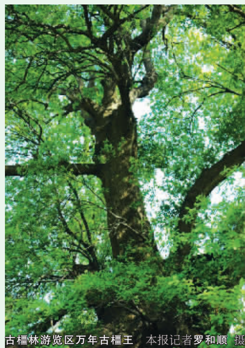
古檀林游览区万年古檀王