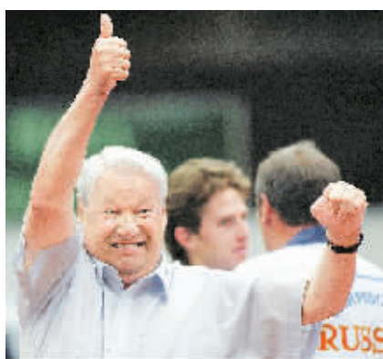
2005年7月17日,叶利钦在参加网球赛获胜后向选手们祝贺。

据新华社4月23日电 克林姆林宫发言人表示,俄罗斯前总统鲍里斯·叶利钦于23日逝世,享年76岁。俄国际文传电讯社援引消息人士称,叶利钦死于心脏病。叶利钦1931年2月1日出生于斯维尔德洛夫斯克州。他自1955年从乌拉尔工学院建筑系毕业后,在斯维尔德洛夫斯克市工作了30年,曾任该市住房建筑联合公司总工程师、经理,1976年任苏共斯维尔德洛夫斯克州委第一书记。叶