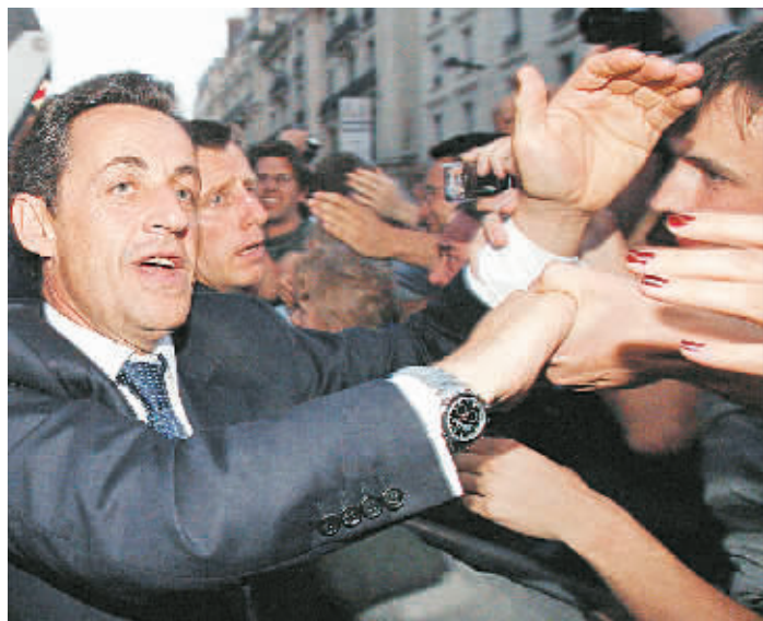
4月22日,在法国巴黎,人民运动联盟主席萨尔科齐(左)在总统选举第一轮投票结果公布后与支持者握手。