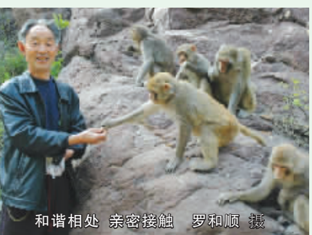
和谐相处 亲密接触