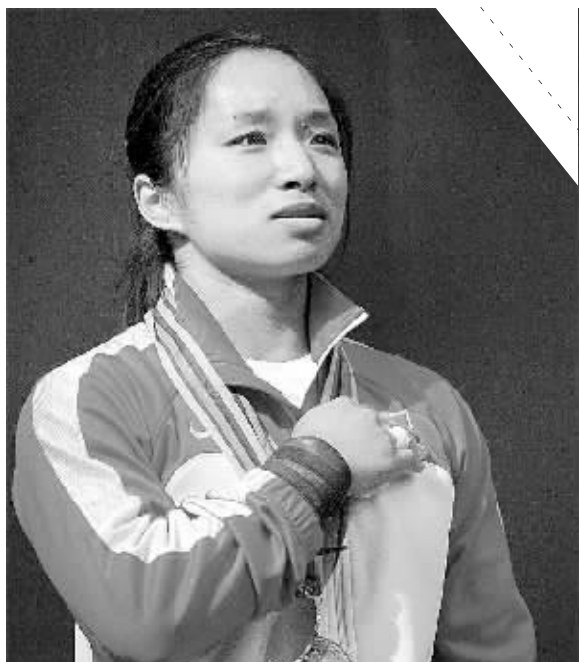
4月23日,中国选手邱红梅在颁奖仪式上。当日,在山东省泰安市举行的亚洲举重锦标赛女子58公斤级比赛中,中国选手邱红梅以141公斤的成绩,创造该级别新的挺举世界纪录,并夺得该级别抓举、挺举和总成绩三枚金牌。