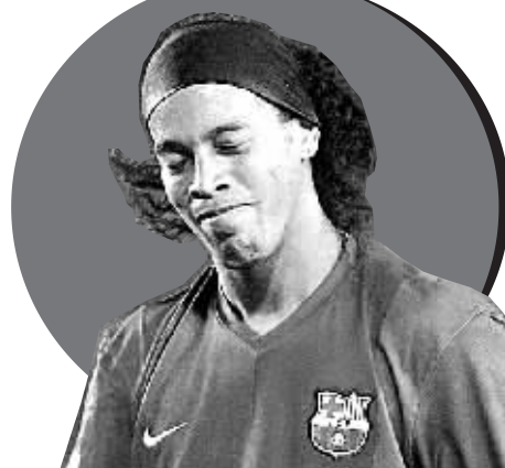
埃托奥(上)和小罗(下)神情懊悔。当日,在西甲联赛第31轮的比赛中,巴塞罗那队客场以0:2负于比亚雷亚尔队。