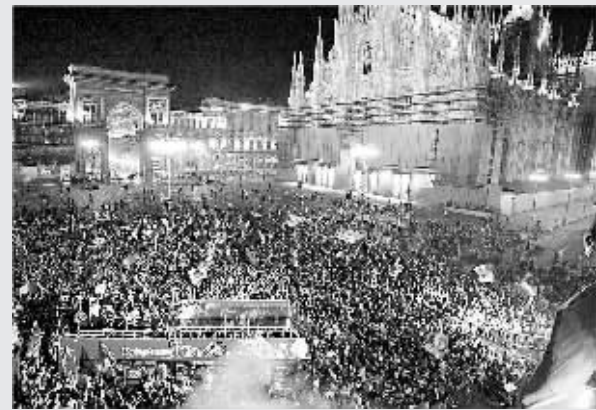
北京时间4月22日晚,意甲第33轮开始6场角逐,国际米兰客场2:1力克锡耶纳,上半时,马特拉齐攻入本赛季联赛第7球,但内格罗随即追平比分。下半时,克鲁斯赢得点球,马特拉齐操刀梅开二度。由于罗马客场负于亚特兰大,国际米兰领先优势达到16分,从而追平了都灵与佛罗伦萨提前5轮登顶的纪录,获得俱乐部历史上第15个意甲冠军。