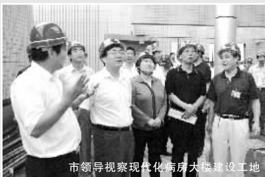
市领导视察现代化病房大楼建设工地