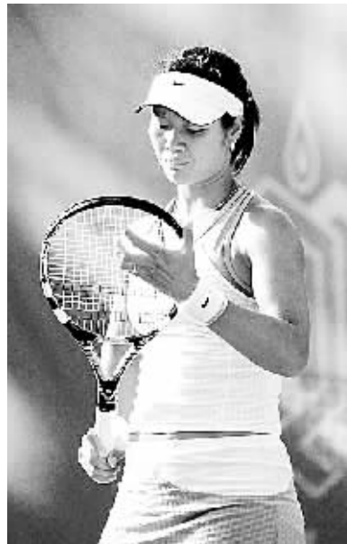
5月9日,中国选手李娜在柏林举行的德国女子网球公开赛单打第二轮比赛中,以1:2不敌意大利选手卡梅琳,无缘第三轮。