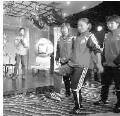
5月10日,国家女足队员曲飞飞(右二)等在活动现场展示球技。当日,在杭州准备热身赛的国家女足姑娘们走进浙江工业大学,接受热爱足球的高校学子们的访问并进行互动活动。