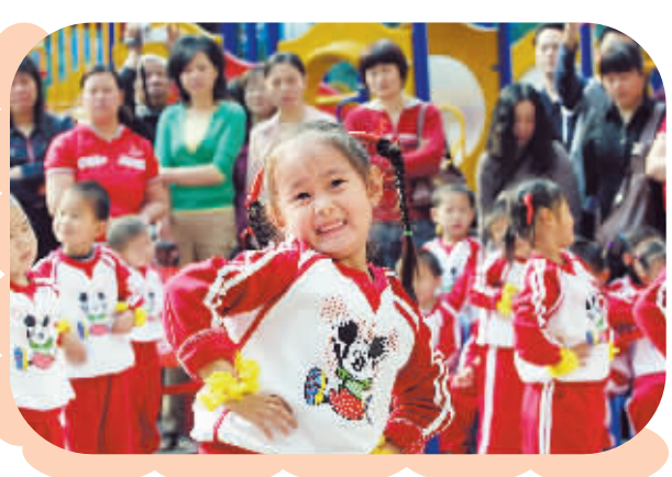
为迎接六一儿童节,汝河一幼编排了动物歌舞操,孩子们模仿各种动物,表演天真可爱的幼儿歌舞。

阿牛说自己明年可能不会再出新专辑,“制作一张专辑需要很多的灵感和劳动,短短一年时间对音乐创作来说太短了。”阿牛说,他希望下一张专辑能像果树一样慢慢成长,“只有精心灌溉,结出的果子才能好吃。” 在曲风上,阿牛说,其实在《天天天天说爱你 Aku Cinta Pada Mu》这张专辑中,他已经试着去改变风格了,希望在下一张专辑中能够创作出风格更为多样的音乐。