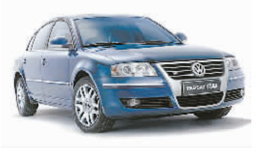
上海大众 PASSAT 领驭

途胜在外观上将传统的 SUV 与轿车风格结合在一起,强调鲜明的车身线条与边缘的统一,表现了其追求都市感、现代感、时尚感的形象;为用户提供了宽绰的车体空间,并通过独到的内部格局实现了空间利用率的最大化;配备全部由电脑控制的主动安全设施,提高了在高速或湿滑路面行驶的安全性;轿车化底盘、风阻设计使驾乘更加舒适;六个安全气囊系统,使其具有出色的安全性,获得了由美国高速公路管理局颁发的最高五星认证;采用“适时智能驱动系统”使它拥有较高的燃油经济性,很大程度避免了传统 SUV 高油耗的弊病。