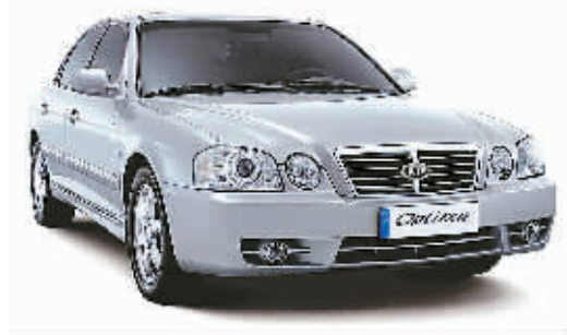
东风悦达起亚 O6 款远舰

4月21日刚刚上市的新世代 CR-V 将运动感和多功能性与轿车的高质感和舒适性完美结合起来,更富价值与魅力,是当今都市 SUV 的经典。外观方面,以轿化了的精练流线、低重心车体,配合精致大气的细节设计,将优雅风度与锐利气度完美交融,更具动感与激情;浅色内饰格调,清新爽朗;蓝色自发光仪表盘,数据一览无遗;高角度可调方向盘,点燃驾驶激情;8向电动智能座椅,体会完美坐姿;宽敞内舱,组合多变的后排座椅,多用途行李储物空间,体现人性关怀,彰显公务舱般的舒适优质感受。