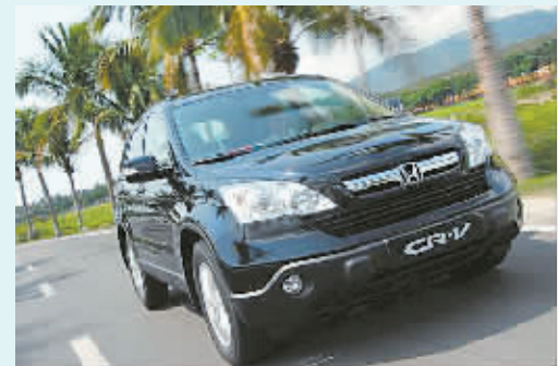
东风 Honda 新世代 CR-V

作为瑞风的第三代更新车型,祥和风格更加轿车化,为驾乘者提供宽大灵活的内部空间,不但在外观内饰上凸显“公商务”庄重内敛之特性,更在同等级价格体系的基础上,配备了双安全气囊、EBD、前后盘式制动、倒车显示屏自动切换、自动天窗系统、八向可调电动座椅、恒温空调、GPS等国际化高端配置。其突出的价格优势以及超高的性价比可以吸引不少实用派消费者。