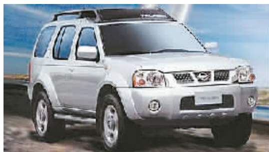
郑州日产 07 款帕拉丁

O6 款远舰的整体造型庄重稳健且不失时尚,车身线条优雅流畅,直线条为主的后部车身设计干净利落,展现出远舰坚韧、强劲的个性;配备了性能卓越的新一代 2.0DOHC 发动机,更省油、环保;安全方面荣获韩国国内汽车碰撞试验 5 星安全基准及美国 4 星安全认证。凭借稳健时尚的外观,宽敞豪华的内部空间、人性齐全的配备、澎湃顺畅的动力以及卓越无比的安全性能,O6 款远舰在中高级车市场中树立起新的性价比标杆,凭借其出类拔萃的表现赢得了众多公、商务人士的青睐。