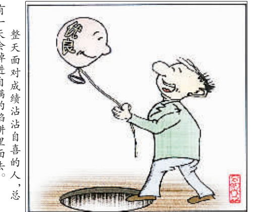
整天面对成绩沾沾自喜的人，总有一天会掉进自满的陷阱里去。

茫茫人海中，人与人之间相遇是一种缘分，也因为缘分，我们的生活才会如此的绚丽多彩。每一天，我们都和缘分纠缠在一起，可以说缘分无处不在，但真正属于我们自己的却很少。你看，地球上60亿人，只有两个人能成为夫妻，三个人能成为朋友，四个人能成为同事，五个人能形成集体，多么不容易，且把这种矛盾重重的诗篇埋在地下，它也许不合你秋天的季节，但到明春定会生根发芽。