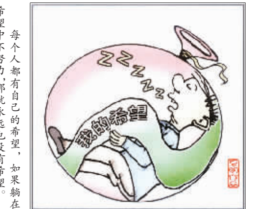
闲言画语 吕育明 作

写于1975年的《团泊洼的秋天》，是郭小川最有影响的作品之一。它发表于《诗刊》1976年11期，此前作者已因粉碎“四人帮”带来的巨大兴奋而突然离世。团泊洼位于天津静海。这个小小的地方，因为一个诗人的一首诗而名气大增。当年设在那里的“五七干校”，是“拯救有罪灵魂”的场所之一。当年这样的场所在全国处处可见。团泊洼见证了诗人的一段生活，孕育了一首不朽的诗篇，它已经和诗歌联系在一起。