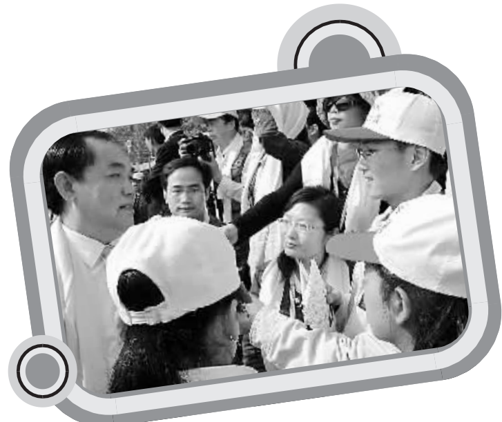
校园记者正在采访来宾