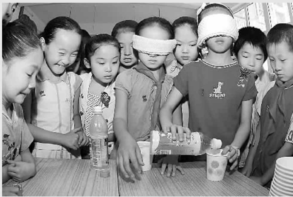
今天是全国第17个助残日。18日,二七区兴华小学开展了“黑暗”特别体验活动,孩子们用厚布蒙上眼睛,试着完成“倒水”、“摸黑上台”等事情。体验后,孩子们纷纷表示,以后会用实际行动来帮助和关爱残疾人。