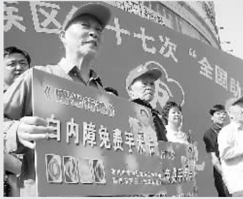
昨日,管城区残联在百盛广场开展“全国助残日”集中宣传活动,向辖区白内障患者和残疾人发放免费手术卡、免费体检卡,并进行了现场义诊。