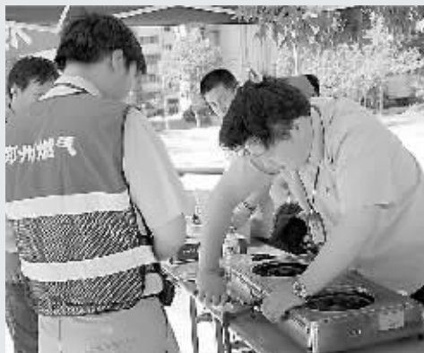
18日,市天然气公司第二分公司“牛师傅”维修小分队来到建中街办事处建华社区,为残疾居民义务维修检查灶具,并开展了安全用气讲座。本报记者 汪静文 张丽霞 摄