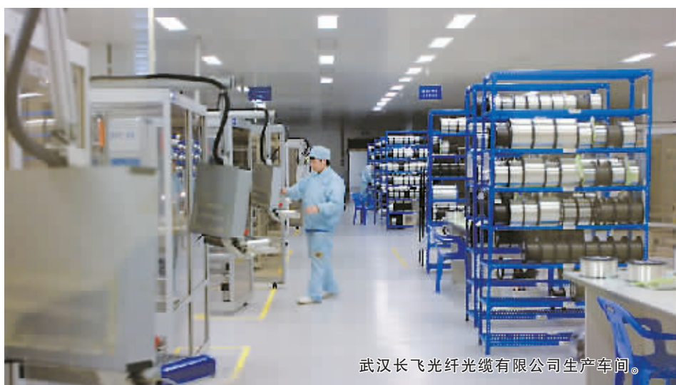
武汉长飞光纤光缆有限公司生产车间。

2000年以来,南京市软件产业持续以50%以上的增速发展,2004年规模达到109亿元,居全国省会城市之首,占据江苏省软件产业半