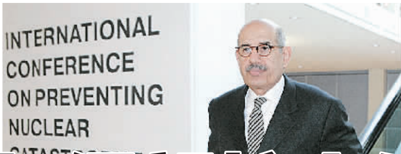
5月24日,国际原子能机构总干事巴拉迪步入在卢森堡举行的关于核问题的国际会议会场。

新华社电 外交部发言人姜瑜24日在答记者问时说,经中日双方商定,中日第八轮东海问题磋商将于25日在北京举行。 姜瑜说,两国领导人已就东海问题达成重要共识。中方也愿意与日方一道,根据两国领导人达成的重要共识,积极推进磋商进程,争取早日找到双方都能接受的共同开发方案。