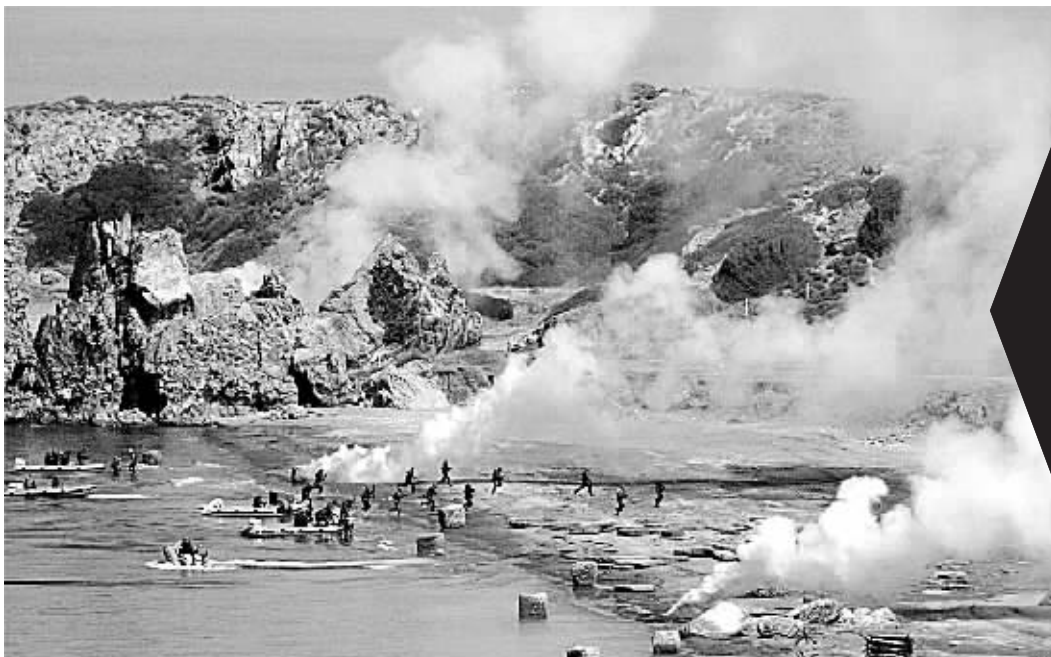
5月25日,土耳其武装部队在西部伊兹密尔省的塞费里希萨地区举行代号为“埃费斯-2007”的陆、海、空三军大规模军事演习。 新华社发

得到尤先科第二次将自己解职的消息后,皮斯昆把媒体记者召集到总检察长办公室,表示将抵制这一命令。他坚持说,这项命令应事先得到议会批准才能生效,而且只有在尤先科在官方报刊上公开刊登这一命令后,他才能执行,就算执行,他也将再次向法院上诉。