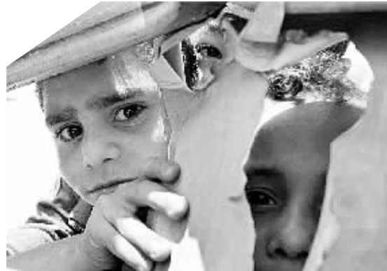
5月25日,几名巴勒斯坦儿童在被炸毁的保释监控室内向外张望。以色列24日午夜发射一枚导弹,袭击了位于加沙城西的巴勒斯坦联合政府总理哈尼亚的保释监控室,但未造成人员伤亡。

被采访的村民说,卖一次血能拿100元,10次就是1000元,算是不小的“收入”。上王庄有700多口人,王美太说,就他所知,村里经常卖血的就有80多人。