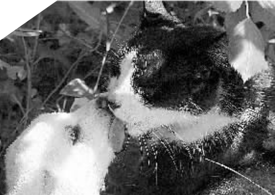
5月24日,在阿尔巴尼亚小镇马姆拉斯,一只猫妈妈轻舔幼猫。这只猫妈妈失去了自己的孩子,正巧几只小猫的妈妈也因车祸丧生,猫妈妈随即承担起抚育小狗的工作。