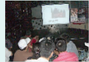
选手们正在认真听取评委点评