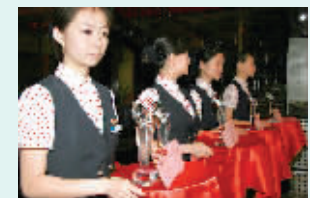
奖杯蕴含全球通俱乐部的一片深情