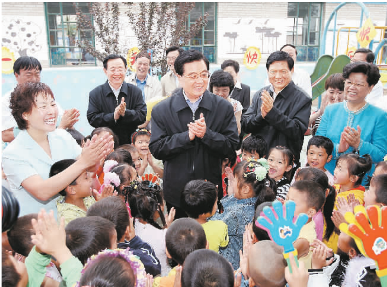
6月1日,中共中央总书记、国家主席、中央军委主席胡锦涛来到北京市大兴区庞各庄镇田园幼儿园和第二中心小学,同孩子们一起欢度“六一”国际儿童节。

在幼儿园的小院子里,胡锦涛兴致勃勃地观看孩子们自编自演的节目。表演结束后,大家兴奋地围拢到胡锦涛身边。胡锦涛对他们说,看到小朋友们在幼儿园学知识、做游戏、演节目,我为你们健康快乐成长感到高兴。小朋友们都是祖国的花朵,希望你们在老师的精心培育下,做爱祖国、爱学习、爱劳动、爱父母、爱老师的好孩子。