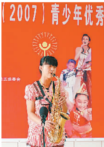
(2007) 青少年优秀艺术新人选拔河南地区复赛昨日在郑州落下帷幕。获得金、银奖的 60 名青少年艺术新人，将于今年 7 月赴北京参加总决赛。

这位策划人之前也曾多次爆料，但真实性均令人质疑。记者致电他问其真实性，他表示绝对真实，并声称自己有与谢东代理人、张姓策划人的聊天记录作为证据。记者随后向其索要证据，他表示，“那些东西在公司的电脑上。后天你们就会在网上看到！” 庆 时