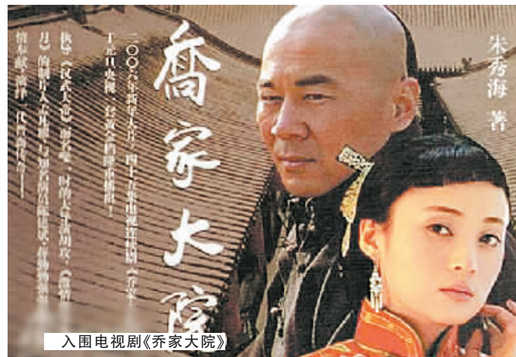
入围电视剧《乔家大院》