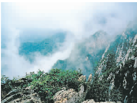
嵩山三皇寨风光。