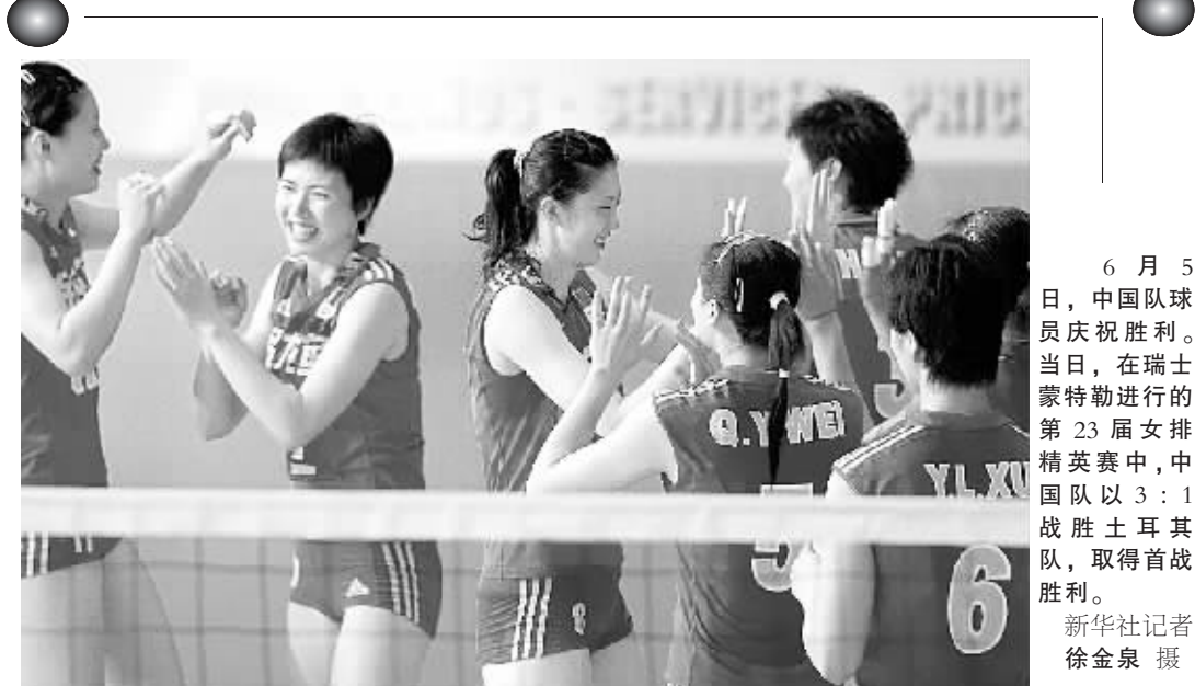
6月5日，中国队员庆祝胜利。当日，在瑞士蒙特勒举行的第23届女排精英赛中，中国队以3:1战胜土耳其队，取得首战胜利。