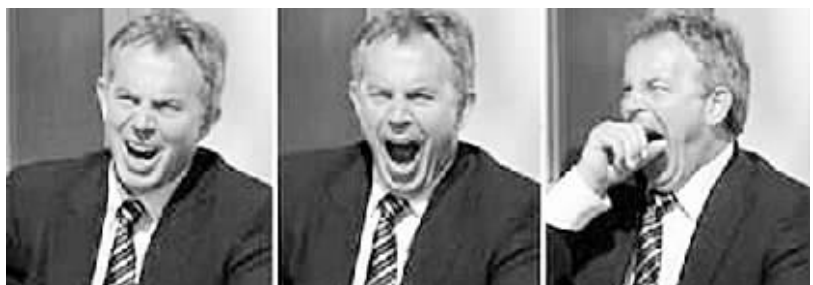
布莱尔 G8 峰会打哈欠

用俄军在阿塞拜疆的雷达站来部署导弹防御系统,不必将导弹防御阵地设在波兰和捷克。 布什称普京的建议“非常有趣”,同意让双方专家就此展开研究。