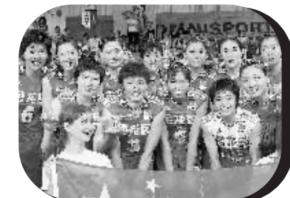
6月10日,在蒙特勒举行的2007年瑞士女排精英赛决赛中,中国队3:0战胜世界劲旅古巴队,夺得冠军。