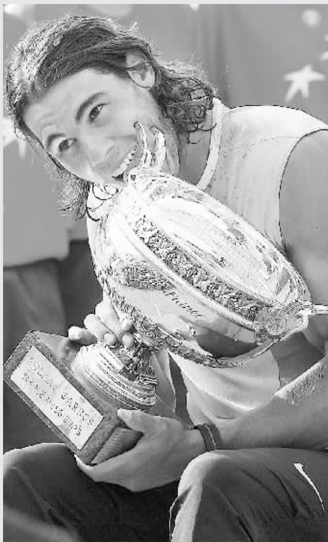
纳达尔在颁奖仪式上。

首先挽救了第一个破发点。到此为止已经挥霍了11次破发机会的费德勒终于把握住第12次,将比分改写为4:3。费德勒最终以6:4扳回一盘。 胜利的天平在第三盘开始向西班牙人倾斜。该盘费德勒仍然失误不断,而纳达尔几乎不怎么失误。在破掉瑞士人第一个发球局后,纳达尔以2:0领先。随后双方均顺利保发,比分最终定格为6:3。该盘费德勒甚至没有破发点。 第四盘,费德勒气数已尽,除了几个ACE球(发球直接得分)外,其他技术环节完全被对手压制。他在第三局丢掉发球局后以4:6输掉整场比赛。