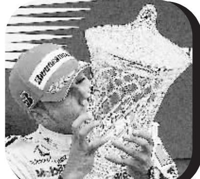
6月10日,在蒙特利尔举行的F1加拿大站比赛中,迈凯轮车队英国车手汉密尔顿以1小时44分11秒292的成绩获得冠军。