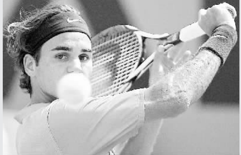
费德勒在比赛中回球。

的意味。然而从另一个角度来讲,正是在同纳达尔尖锐的“土地革命”当中,费德勒才得以不断地进步,以至于今天能至少自称为红土第二高手。因为两位球员总共七次土场较量中,有六次发生在决赛,而且不是法网就是大师赛级别的比赛,可见两人的竞争已经将整个世界抛在了身后。 不过从这场决赛看来,纳达尔在红土上似乎在向更高级别的台阶迈进,而费德勒的抗争几乎让人看不到希望。尤其是在费德勒表示每次同纳达尔交手前都会专门布置战术后,就越发让人相信费德勒职业“全满贯”的努力将最后落空。 在评价纳达尔的特点时,费德勒说:“纳达尔的跑动非常积极,他拥有出色的身体素质,击球有力。更重要的是,他的心理素质非常强悍,这一点对于一位只有21岁的年轻球员而言很不可思议。” 是的,纳达尔在当日的比赛里不仅表现出压倒性的技术优势,并且淋漓尽致地向人们展现出强硬的性格。是役费德勒总共创造出17个破发点,最后竟然只抓住了一个,其中在第一盘瑞士人手握10个破发点最终颗粒无收,而纳达尔在该盘总共只有两个破发机会,却全部转化成得分。西班牙神奇小子全场拿到10次破发点,其中4次命中,成功率高达40%,而费德勒只有可怜的6%。本场比赛费德勒共犯下60次非受迫性失误,远远超过纳达尔