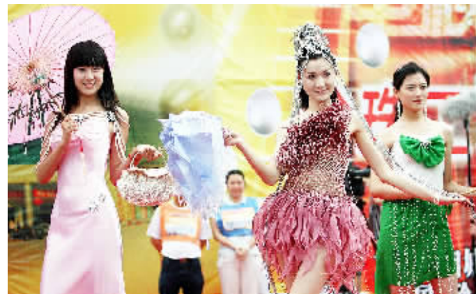
6月13日，模特在苏州举行的珍珠服饰秀上展示珍珠服饰。