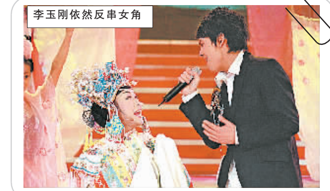
李玉刚依然反串女角