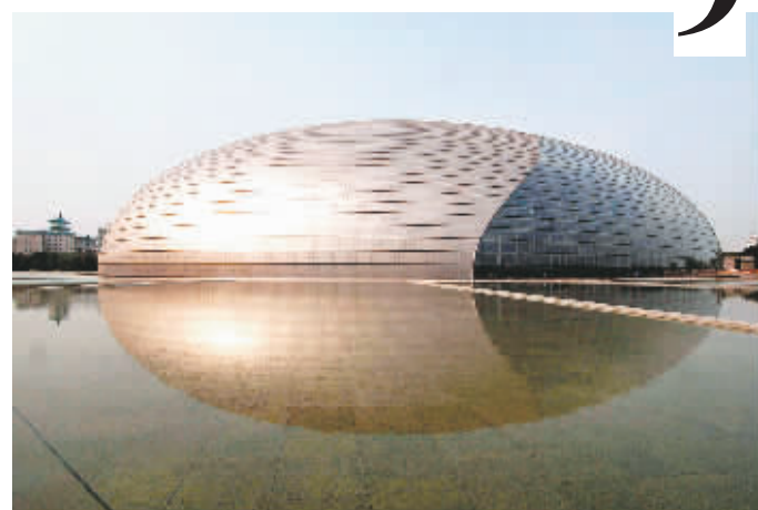
6月14日，国家大剧院在人工湖水面上留下美丽的倒影。国家大剧院外部将于15日正式亮相。人们从长安街上可一览无余地欣赏到国家大剧院的正面景观。

媒体向导演两位男主角有没有用替身时，他没有做正面回答，成龙大哥落落大方的承认：“我们分AB组拍，一定有用替身的。” 张秀琼