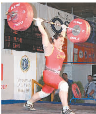
6月14日,中国选手李娟在捷克首都布拉格举行的2007年世界青年举重锦标赛女子69公斤级比赛中,获得抓举铜牌、挺举银牌和总成绩银牌。