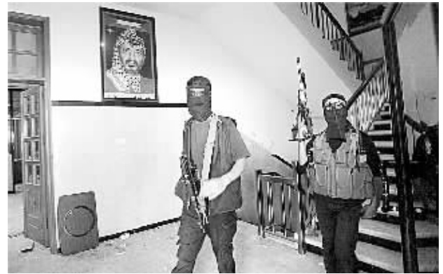
6月15日,两名巴勒斯坦伊斯兰抵抗运动(哈马斯)武装人员进入阿巴斯位于加沙城的官邸。

巴勒斯坦伊斯兰抵抗运动(哈马斯)14日攻占巴民族解放运动(法塔赫)位于加沙地带的多处重要军事设施,几乎控制了整个加沙地带。巴民族权力机构主席阿巴斯当天晚些时候宣布解散民族联合政府,约旦河西岸和加沙地带进入紧急状态。