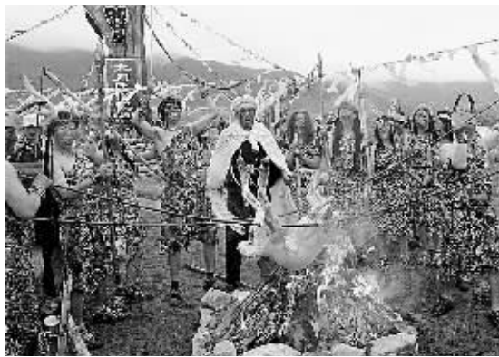
6月15日,新疆巴里坤县歌舞团的演员在兰州湾子古人类聚落遗址旁,以舞蹈形式演绎3000年前大月氏人生活场景,这台舞蹈根据考古发现和大月氏遗存岩画创作编导。

陈水扁“机要费”贪腐案去年12月15日首次开庭,吴淑珍到庭应诉后因身体不适被送往医院。此后,该案十余度开庭,吴淑珍就再没有出现。